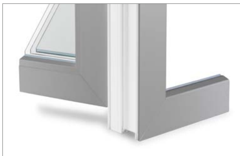
Même vernis à l'intérieur et à l'extérieur