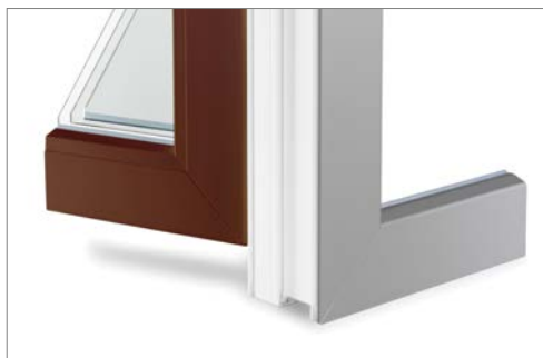
Différents vernis à l'intérieur et à l'extérieur